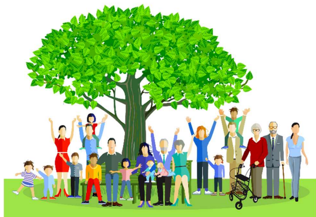
Eén stam - vele takken

NIEUWSBRIEF OVER EN VOOR DE FAMILIE ANGENENT – NR. 04/ 2021