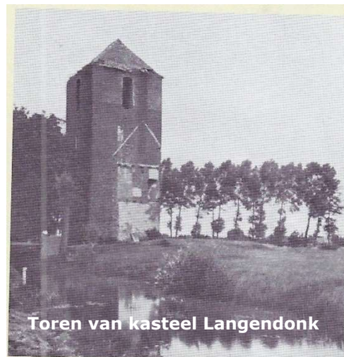
Toren van kasteel Langendonk

We moeten in beginstel bij een hof of hoeve niet aan een kasteel of burcht denken. Zo groots was het allemaal niet, ook niet voor de meeste adel.