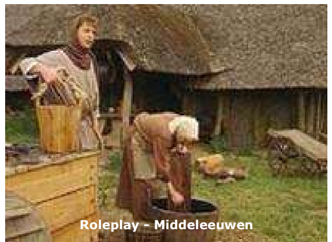
Roleplay – Middeleeuwen

Volgende keer in Uitgelicht: Bisschop Joannes Aengenent 1873-1935