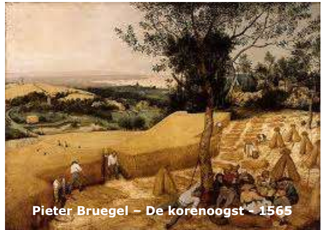
Pieter Bruegel – De korenoogst - 1565

Op de website onder het kopje Nog te onderzoeken de specifieke genealogische zoekvragen waarbij je kunt helpen.