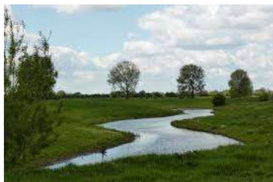
Rivier de Niers

De verklaring van het weglaten van de d lijkt het idee te staven, zonder dat we dat met oude documenten kunnen bewijzen, dat de allereerste vorm van onze stamboomnaam Angenent in de 13de en 14de eeuw niet aen gen Eijndt is geweest, maar een nog oudere vorm, namelijk aang de Eijndt of aengde Eijndt met de letter d nog aanwezig. Aan het einde van de 17de eeuw en aan het begin van de 18de eeuw was de ontwikkeling van onze familienaam bijna afgerond. Het gebruik van de nassaal-n en het weglaten van de letter d was in de omgeving van Gelre inmiddels algemeen gebruik. Toen de familienamen midden 19de eeuw verplicht moesten worden opgeschreven werden de lettergrepen samengevoegd tot Angenent.