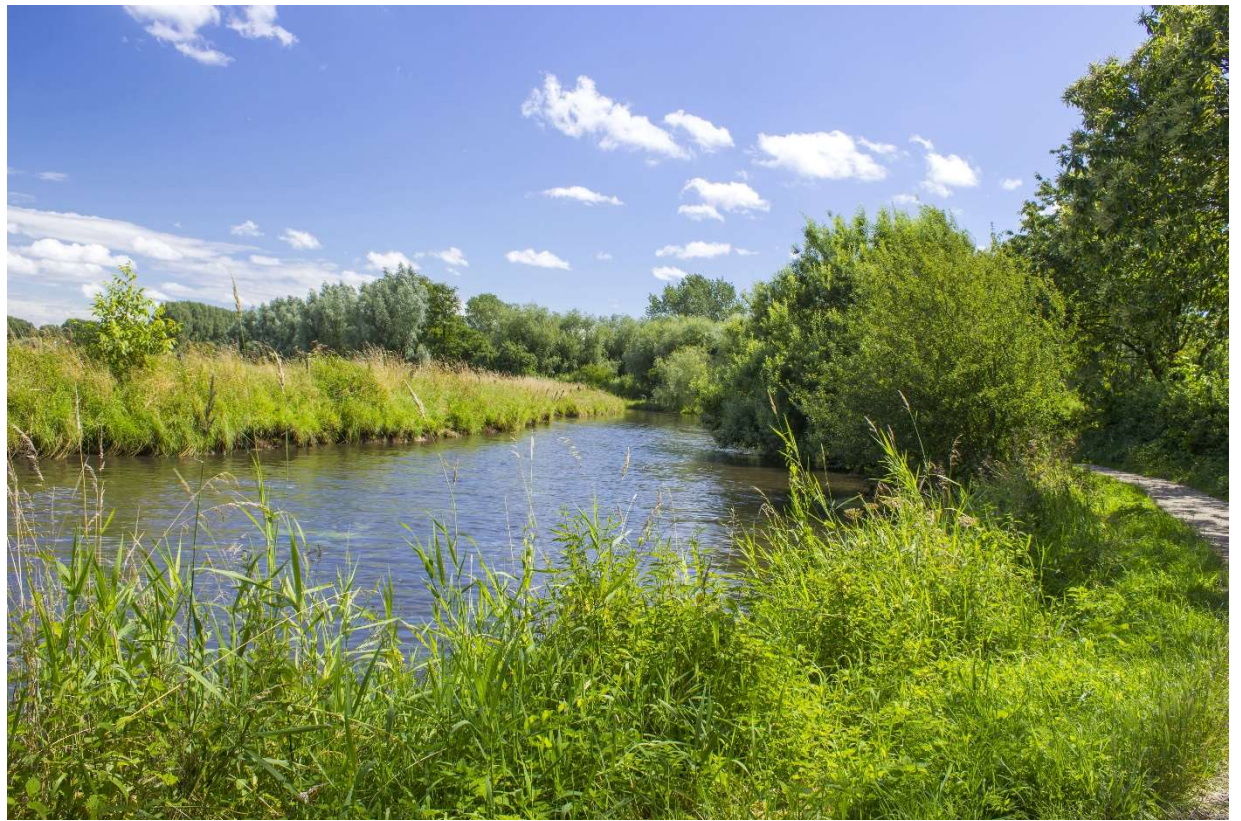
Rivier de Niers