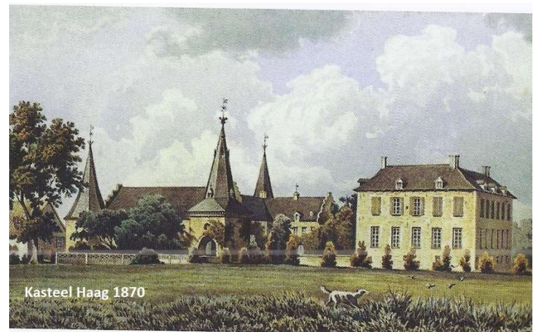
Kasteel de Haag 1870