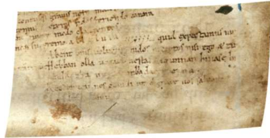
Het liefdesliedje uit 1075

Ontwikkeling. De Middelnederlandse n als sluitletter van een woord werd uitgesproken als een nassaal-n . Uitgesproken klonk dat als een ng achter in de keel zoals bij wang . Zie ook het artikel Angenent uitspreken op de website. Het werd in het Middelnederlands dan wel geschreven als aen de , maar uitgesproken als aangde . Een zin is bijvoorbeeld: “Geeft hem een ring aan de hand. In het Middelnederlands is het: “geft